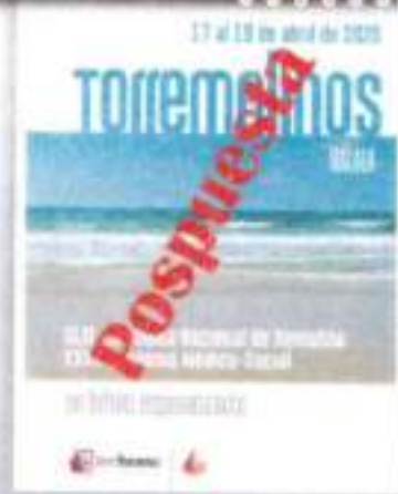
XLIX Asamblea Nacional de Hemofilia Xullo 2020

Handwritten signatures and notes at the bottom of the page.