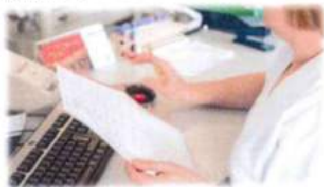
Parte do proceso Saludtinere

As persoas destinatarias deste programa son, con hemofilia e as persoas que presenten algún outro tipo de coagulopatía congénita - 81 homes e 20 mulleres.