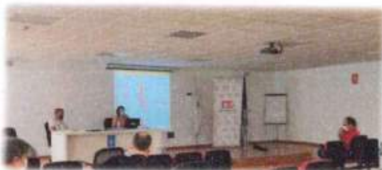
Asembleas Ordinaria e Extraordinaria de Agadhemo. Santiago, Xullo 2020

Agadhemo Asociación Española de Hemofilia